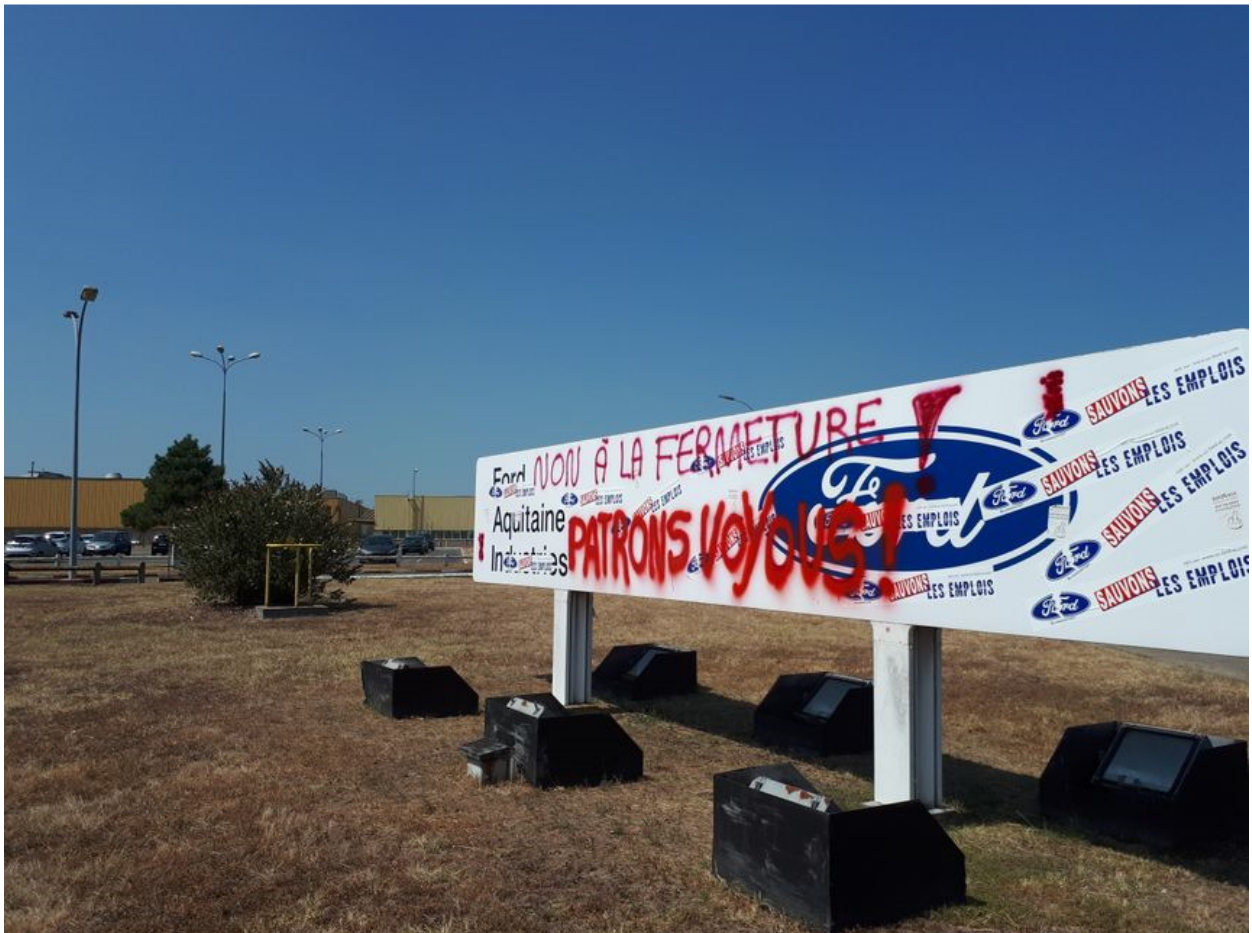
L'entrée du site taguée par les salariés en colère

Ils ont de l'argent, alors ils n'hésiteront pas à faire mourir l'usine à petit feu en nous payant à ne rien faire - Gilles Lambersent, délégué CGT de l'usine de Blanquefort