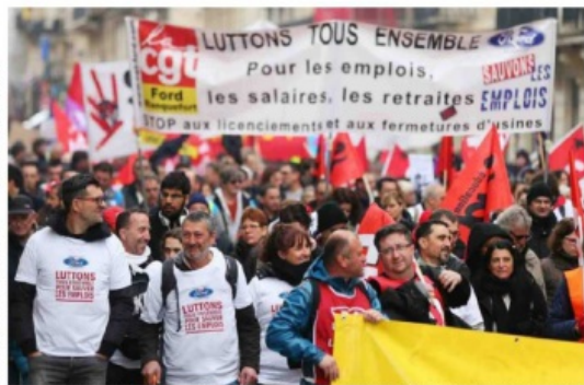
Les syndicats sont très militants sur la reprise de l'usine, après l'échec des négociations avec Ford.

Des élections prévues Les élections municipales de 2017 sont prévues pour le mois de mai. Les salariés de Ford Aquitaine Industrielle se demandent si l'État va intervenir pour la reprise de l'usine.