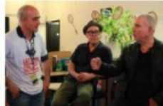
Bernard Lavilliers au concert à Blanquefort.

Phonèmes et applications C'est le thème de la journée de soutien organisée à Blanquefort. Les salariés de Ford Aquitaine Industrielle ont participé à des ateliers-debats et à un concert avec Bernard Lavilliers.