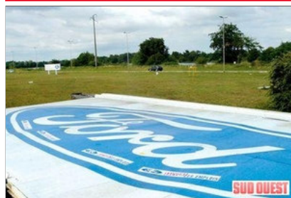
Le panneau de 32 mètres carrés gît sur le sol depuis vendredi. À partir d'aujourd'hui, il est découpé en morceaux.

Vendredi, 16 h 10, ils sont tombés à terre. Après un long week-end d'agonie au sol, le grand panneau Ford et son mât vont être découpés au chalumeau à partir de ce matin.